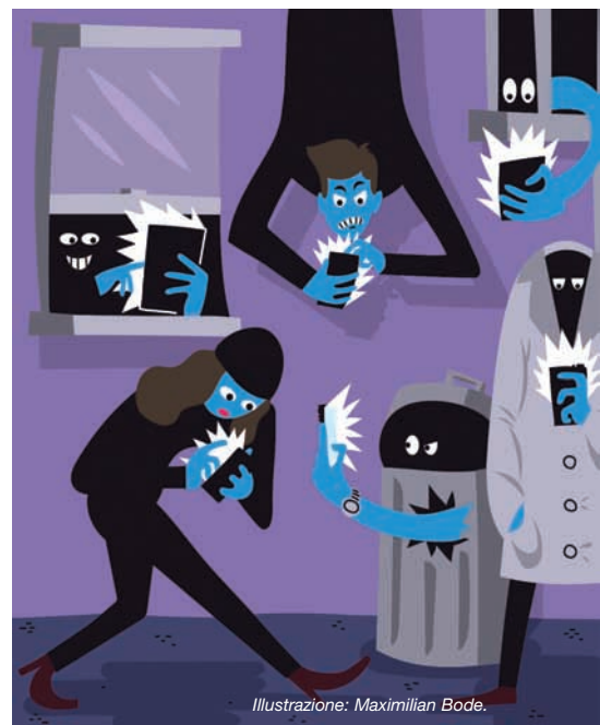
Illustrazione: Maximilian Bode.

Comunque, preferisco Secret, che ha una struttura più semplice e ha preso piede in fretta soprattutto in una nicchia precisa: il regno del gossip aziendale. L’applicazione ha due schede. Una mostra i “segreti” degli amici e degli amici degli amici, anche se non si può sapere chi siano in realtà queste persone. L’applicazione, infatti, collega l’utente alla rete sociale prendendo in considerazione i suoi contatti telefonici e cercando quelli